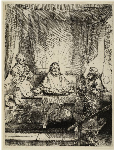
Christus te Emmaüs, 1654

De Nederlandse toerist die deze tentoonstelling bezoekt, waant zich even terug in eigen land. Alsof het Rembrandthuis verplaatst is naar de Thunersee. Hij krijgt typisch Nederlandse plaatjes voorgetoverd, zoals het Gezicht op Amsterdam of het Landschap met drie bomen .