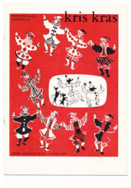
Het kinderblad Kris Kras.